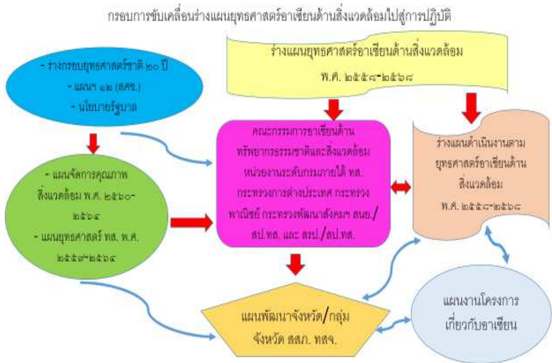
ภาพที่ ๔ กรอบการขับเคลื่อนร่างแผนยุทธศาสตร์อาเซียนด้านสิ่งแวดล้อมไปสู่การปฏิบัติ