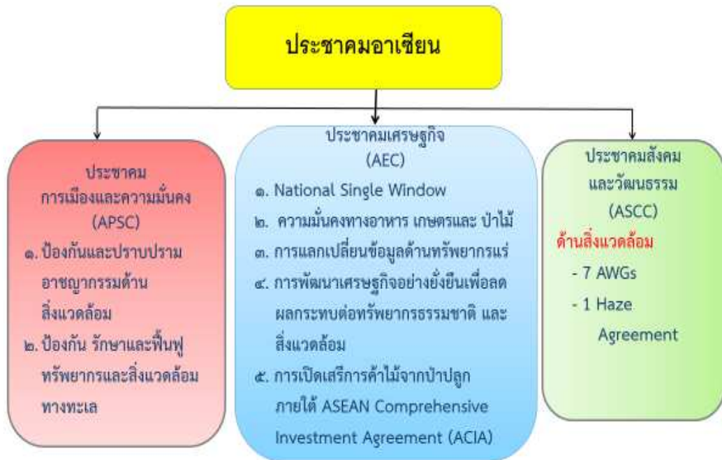
ภาพที่ ๑ ประเด็นสิ่งแวดล้อมที่มีความคาบเกี่ยวกับการดำเนินงานทั้ง ๓ เสา

อย่างไรก็ตาม ภารกิจของกระทรวงทรัพยากรธรรมชาติและสิ่งแวดล้อมมีประเด็นความเชื่อมโยงกับประชาคมเศรษฐกิจอาเซียนในเรื่องการเปิดเสรีการค้าป่าไม้จากป่าปลูก ภายใต้ความตกลงด้านการลงทุนอาเซียน (ASEAN Comprehensive Investment Agreement: ACIA) ความร่วมมือเรื่องการจัดการป่าไม้ภายใต้ความรับผิดชอบของกรมป่าไม้ และความร่วมมือในการป้องกันการลักลอบค้าสัตว์ป่าและพืชป่าผิดกฎหมาย ภายใต้ความรับผิดชอบของกรมอุทยานแห่งชาติ สัตว์ป่า และพันธุ์พืช รวมถึงยังมีเรื่องทรัพยากรแร่ ซึ่งกรมทรัพยากรธรณี เข้าร่วมเป็นคณะทำงานด้านสารสนเทศและฐานข้อมูลแร่